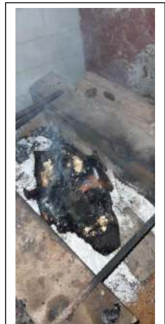
Het schildpadhuis wordt verbrand om slechte geesten te verjagen van je omgeving of erf.

De mannen brachten het bij de grot en maakten hun smoko patu aan. De rook begon de grot binnen te dringen en de baboen die niet naar buiten wilde komen, begon uit te schelden van: "Jullie Indianen, hoe durven jullie hier te komen, helemaal hier in mijn huis. Hoe durven jullie. Jullie gaan zien als ik eruit kom". Ze bleven die smoko patu gebruiken, steeds meer en meer en op gegeven moment, als je in een dichte ruimte bent met heel veel rook, ga je tenslotte eruit moeten komen. En hij