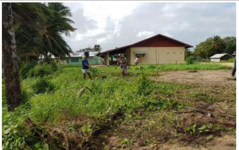
Bewoners houden Galibi schoon

De dorpsbesturen bleven niet bij de pakken neerzitten en bleven bij de overheid aandringen op een oplossing. Uiteindelijk hoorden we dat Galibi ook in aanmerking kwam voor een verbrandingsoven. Het staat al in het dorp, de dorpingen zijn er heel blij mee en zo helpen wij ook mee aan een SCHOON MILIEU!