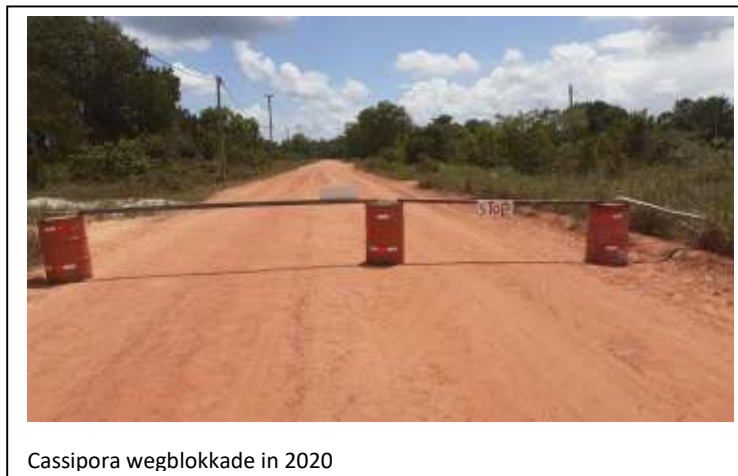
Cassipora wegblokkade in 2020

waarvan twee mensen zijn overleden. “Ik denk dat overgewicht een rol heeft gespeeld bij de Inheemsen die aan het coronavirus is bezweken”, haalt Tawadi een mogelijke reden aan.