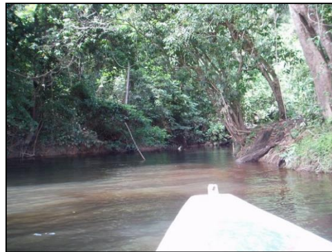
Epira. Links White Hill, rechts de monding van Epira Kreek.

Corantijn rivier tussen Epira kreek en White Hill. Volgens verhalen van de oudere inheemsen was Epira woongebied van Warraus en Arowakken. Er was een school en een kerk, en de mensen leefden van hun