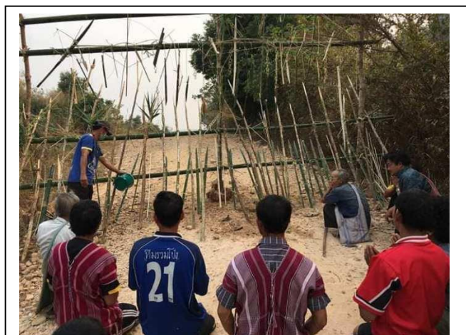
Ritueel “Kroh Yee”, Thailand.

Het is voor inheemsen een bekende vijand die van oudsher hun bestaan bedreigt: de snelle