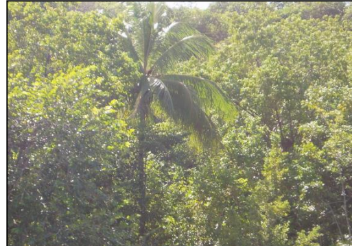
Vanaf de rivier zijn alleen de fruitbomen nog zichtbare overblijfselen van het dorp Epira.