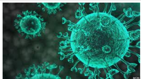
Afbeelding van het coronavirus dat de ziekte COVID-19 veroorzaakt. Een virus is zo klein dat je het niet met het blote oog kan zien

COVID-19 staat voor Corona Virus Disease 2019, dat is een soort griep die veroorzaakt wordt door een nieuw virus waartegen nog geen medicijnen of vaccinatie zijn gevonden. Dit virus is erg besmettelijk en verspreidt zich heel snel. Mensen die het virus hebben, kunnen het overdragen aan anderen, nog voordat ze zich ziek voelen. De meeste mensen met dit virus krijgen lichte klachten zoals bij een gewone griep of verkoudheid, voornamelijk koorts en droge hoest. En je kan ook lichaamspijn, hoofdpijn, vermoeidheid of misselijkheid voelen. Als het verergert, krijg je pijn op de borst, benauwdheid en kan je moeilijk ademen omdat het je longen aantast. Is je weerstand goed, dan word je vanzelf weer beter. Maar bij mensen met een lage weerstand, vooral ouderen en mensen met een chronische ziekte waaronder diabetes, hoge bloeddruk, hart- en vaatziekte, kan er een ernstige longontsteking ontstaan en kunnen hieraan doodgaan.